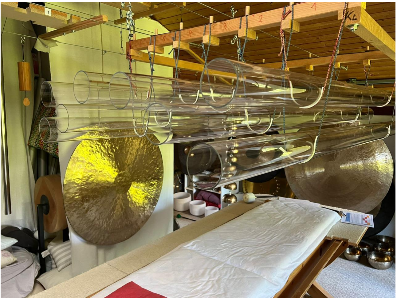
Die Klangliege mit den WoRo-Klangröhren aus reinem Quarz

Egal welche Seite bei uns dominiert, die Harmonie der Gehirnhälften unterstützt sowohl unser rationelles Denken als auch unsere kreative Ader und unsere Intuition. Binaurale Klänge gelten schon lange als einfache, aber hoch effektive Mittel, um rechte und linke Gehirnhälfte in Einklang zu bringen.