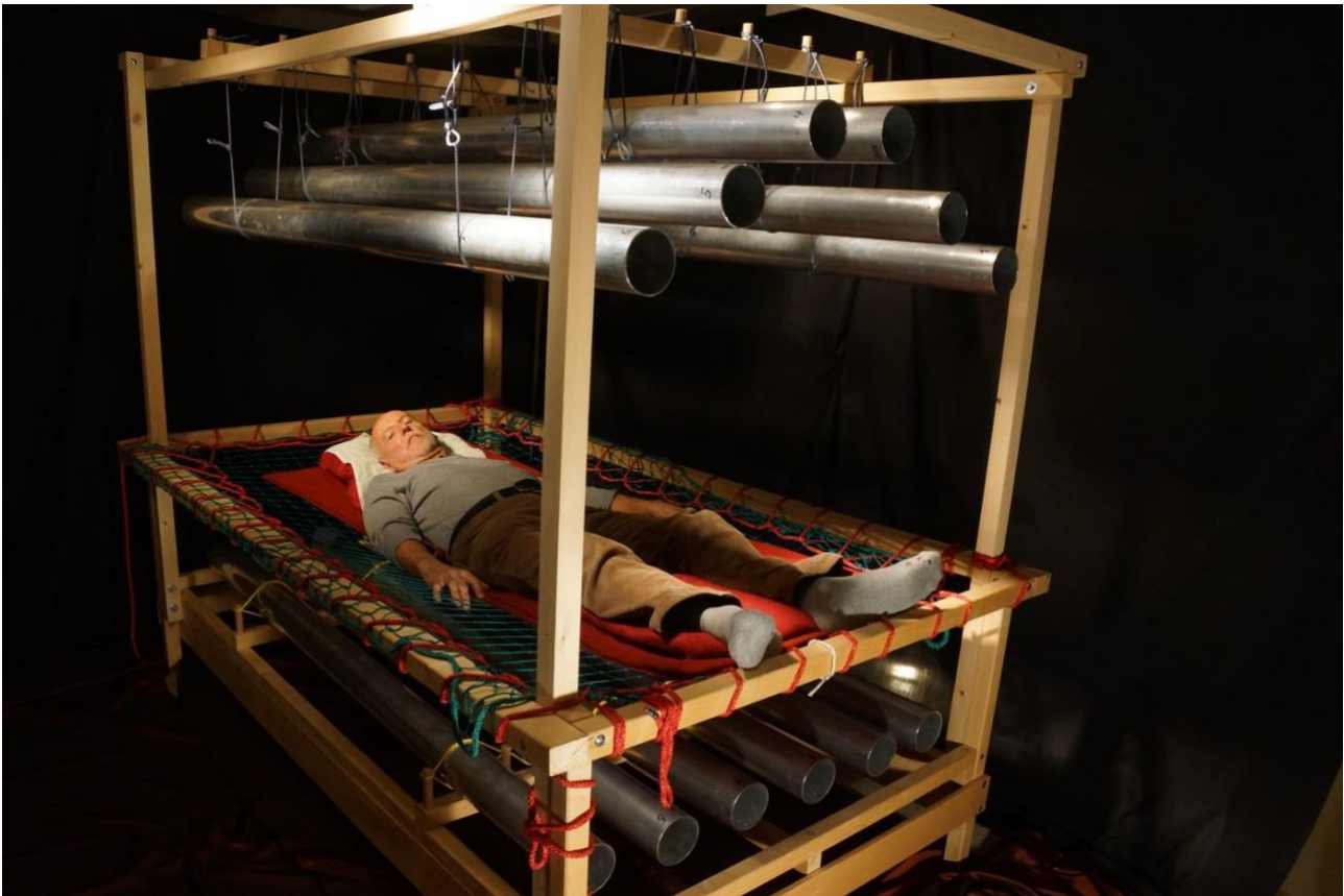
Die WoRo-Klangliege während der Entwicklungszeit