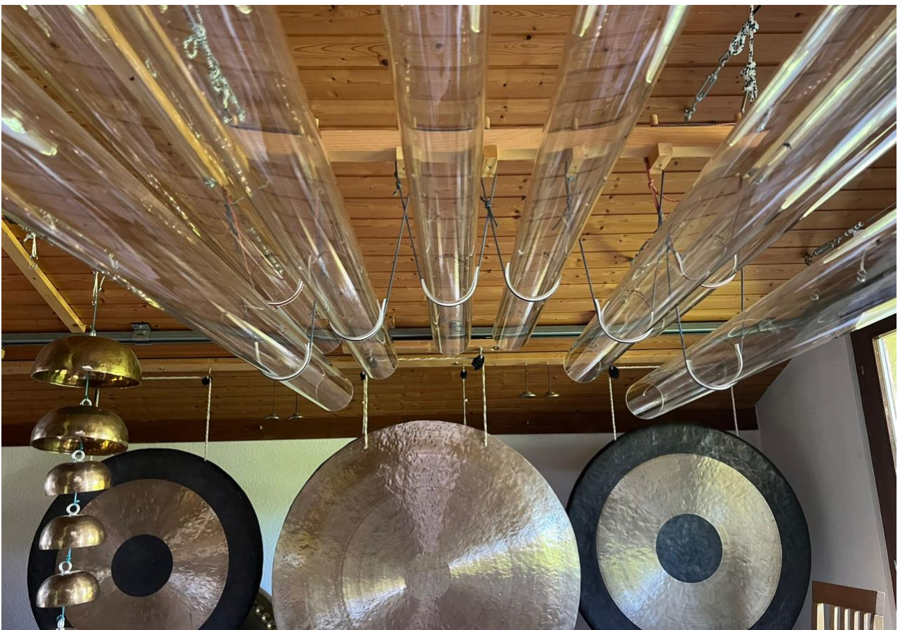
Die neu entwickelten WoRo-Klangröhren aus reinem Quarz

Erleben Sie eine Klang-Einzelsitzung mit Klangröhren zur Aktivierung Ihrer Selbstheilungskräfte und geniessen Sie tiefste Entspannung und eine Reise zu Ihrem Innersten.