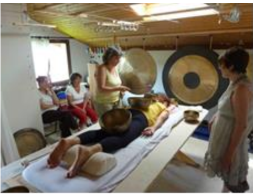
Jeder gibt und bekommt Klang