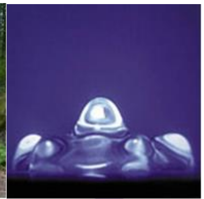
Wirkung von Klang, Video