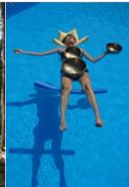
Klang im Wasser