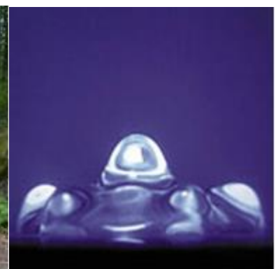
Wirkung von Klang, Video