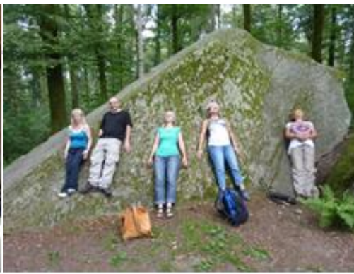
An Kraftorten Energien Spüren