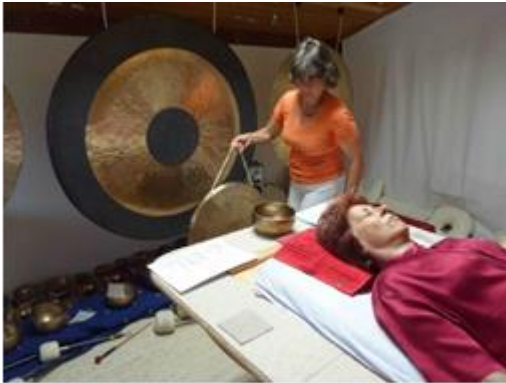
Üben mit Klangschalen und Gongs