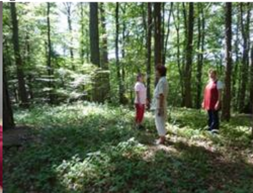
Wanderungen in der Natur