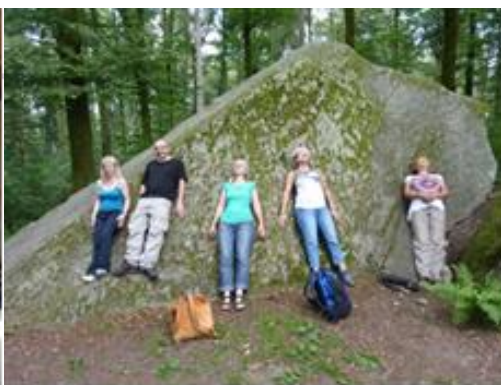
An Kraftorten Energien Spüren