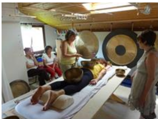
Jeder gibt und bekommt Klang